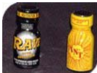
Flacons de Poppers

Ces substances, vendues principalement dans les sex-shop et recherchées pour leur action relaxante vasculaire et musculaire (par libération du radical NO) sont utilisés en inhalation comme « jouets sexuels ».